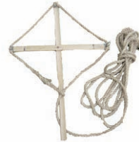
十字 割竹を十字に組み、 縄を掛けた捕獲具

勢子たちが「赤旗」を持ち、角きり場内に立派な角鹿を追い込みます。「十字」を持った勢子が鹿の角に縄をかけます。鹿はゴザの上に寝かされ、神官役が興奮した鹿の口に水差して水を含ませ気を静めた後、ノコギリで角を切り落とします。鹿は神様のお使いの「神鹿」とされてきたことから、神官役が角を切り、神前に供えます。