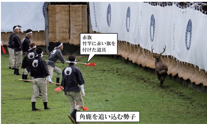
赤旗 竹竿に赤い旗を 付けた道具