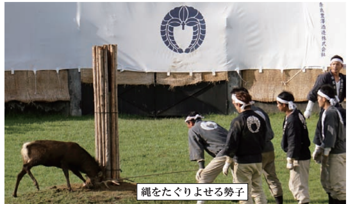
縄をたぐりよせる勢子