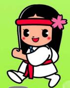
桜井市マスコットキャラクター 「ひみこちゃん」