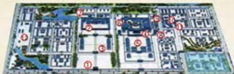
①朱雀門 ②西宮 ③中央の朝堂院 ④第二次大極殿 ⑤東の朝堂院 ⑥内裏 ⑦大膳廳 ⑧宮内省 ⑨大藏省 ⑩太政官 ⑪造酒司 ⑫馬寮