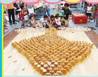
東京おもちゃ美術館から、300種以上の木のおもちゃが大集合します！