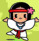
桜井市マスコットキャラクター 「ひみこちゃん」