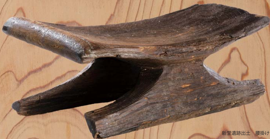
新堂遺跡出土 腰掛け(古墳時代)