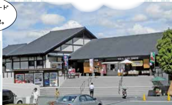
たいま 道の駅ふたかみパーク当麻「当麻の家」