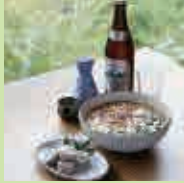
鴨葛うどん 又は ドリンクと おつまみ

中-01 静亭 食事 1/18(土) 10:00~21:00 2/2(日) 10:00~21:00 2/8(土) 10:00~21:00