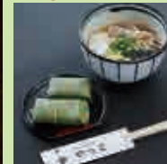
和風 中華そばと 柿の葉すしの セット

中-17 柿の葉すし やっこ 食事 ライブ会場 1/18(土) 9:00~21:00 2/2(日) 9:00~21:00 2/8(土) 9:00~21:00