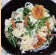
オススメ どんぶり

下-18 笹岡食堂 食事 2/1(土) 10:00~17:00 2/2(日) 10:00~17:00