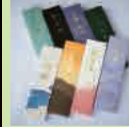
線香 8種類から 3個

中-14 車田商店 土産 1/18(土) 9:00~21:00 2/2(日) 9:00~21:00 2/8(土) 9:00~21:00