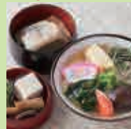
葛うどん定食 ※チケット2枚

中-16 お食事処 はるかぜ 食事 1/18(土) 10:00~17:00 2/2(日) 10:00~17:00 2/8(土) 10:00~17:00