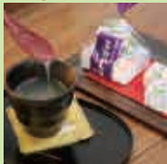
葛湯5個 セット + 店内にて 葛湯1杯

中-05 横矢芳泉堂 土産 1/18(土) 9:00~21:00 2/2(日) 9:00~21:00 2/8(土) 9:00~21:00