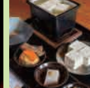
とうふ おつまみ セット

中-12 豆腐茶屋 林 食事 1/18(土) 10:30~21:00 2/2(日) 10:30~21:00 2/8(土) 10:30~21:00