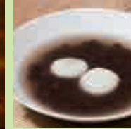
葛入り白玉 ぜんざいと お土産葛湯

中-15 葛屋 中井春風堂 食事 1/18(土) 10:00~21:00 2/2(日) 10:00~21:00 2/8(土) 10:00~21:00