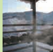
日帰り入浴 フェイス タオル付き

中-07 湯元 宝の家 風呂 1/18(土) 15:00~21:00 2/2(日) 15:00~21:00 2/8(土) 15:00~21:00