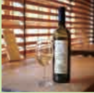
オーガニック ワインと おつまみ 一品

中-03 TSUJIMURA&cafe kiton 食事 1/18(土) 10:00~21:00 2/2(日) 10:00~21:00 2/8(土) 10:00~21:00