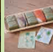
柿の葉すし 鯖3個・ 鮭2個

中-08 柿の葉すし 醒予 土産 1/18(土) 9:30~21:00 2/2(日) 9:30~21:00 2/8(土) 9:30~21:00