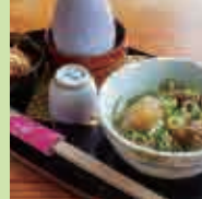
筋、大根、 こんにゃく煮 込み+なます +1ドリンク

中-10 甘味処 弁慶 食事 ライブ会場 1/18(土) 10:30~21:00 2/2(日) 11:00~17:00 2/8(土) 11:00~17:00