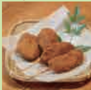
鹿肉串カツ 2本・ コロッケ 2個

中-04 枳殻屋 食事 1/18(土) 9:00~21:00 2/2(日) 9:00~21:00 2/8(土) 9:00~21:00