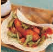
鬼タコスと 飲み物セット

下-17 さくら堂 食事 2/1(土) 11:00~16:00 2/2(日) 11:00~16:00