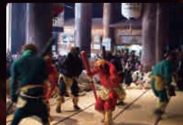
11時～ 鬼踊り／鬼の調伏式

「福は内、鬼も内」と唱える金峯山寺の鬼の調伏式は、全国でも極めて珍しい節分会の行事です。また、午後からは豆まきも行われます。