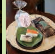
柿の葉すし 鮭・鯖 各2個 吉野葛

中-09 柿の葉すし たつみ 土産 1/18(土) 10:00~21:00 2/2(日) 10:00~21:00 2/8(土) 10:00~21:00